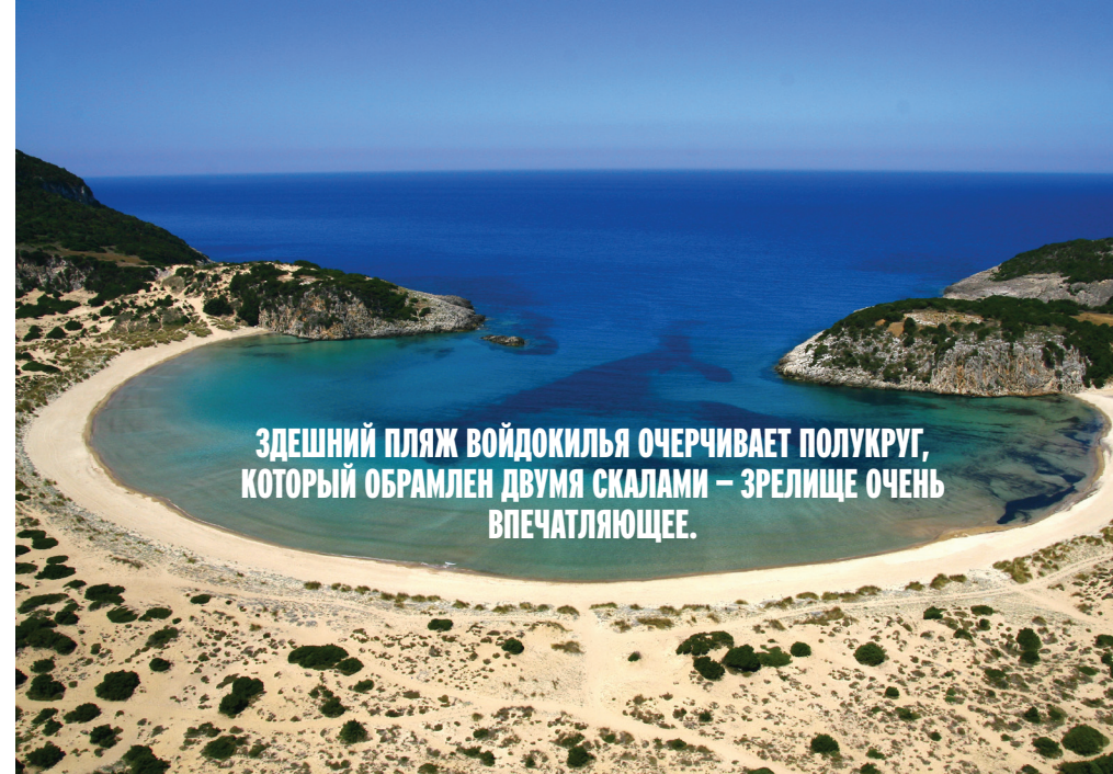
ЗДЕШНИЙ ПЛЯЖ ВОЙДОКИЛЬЯ ОЧЕРЧИВАЕТ ПОЛУКРУГ, КОТОРЫЙ ОБРАМЛЕН ДВУМЯ СКАЛАМИ – ЗРЕЛИЩЕ ОЧЕНЬ ВПЕЧАТЛЯЮЩЕЕ.

Проснувшись утром по возвращении домой, я ощутила на себе легкий ускользающий аромат трав и поняла, что мой отдых на греческом курорте был сказкой наяву, в которой хочется оказаться снова.