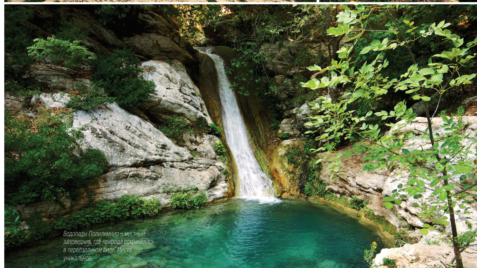
Водопады Полилимнио – местный заповедник, где природа сохранилась в первозданном виде. Место уникальное.