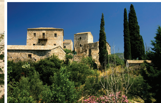
Можно выбрать в живописную деревню Кардамили, о которой упоминал Гомер в «Илиаде» как об одном из процветающих городов.