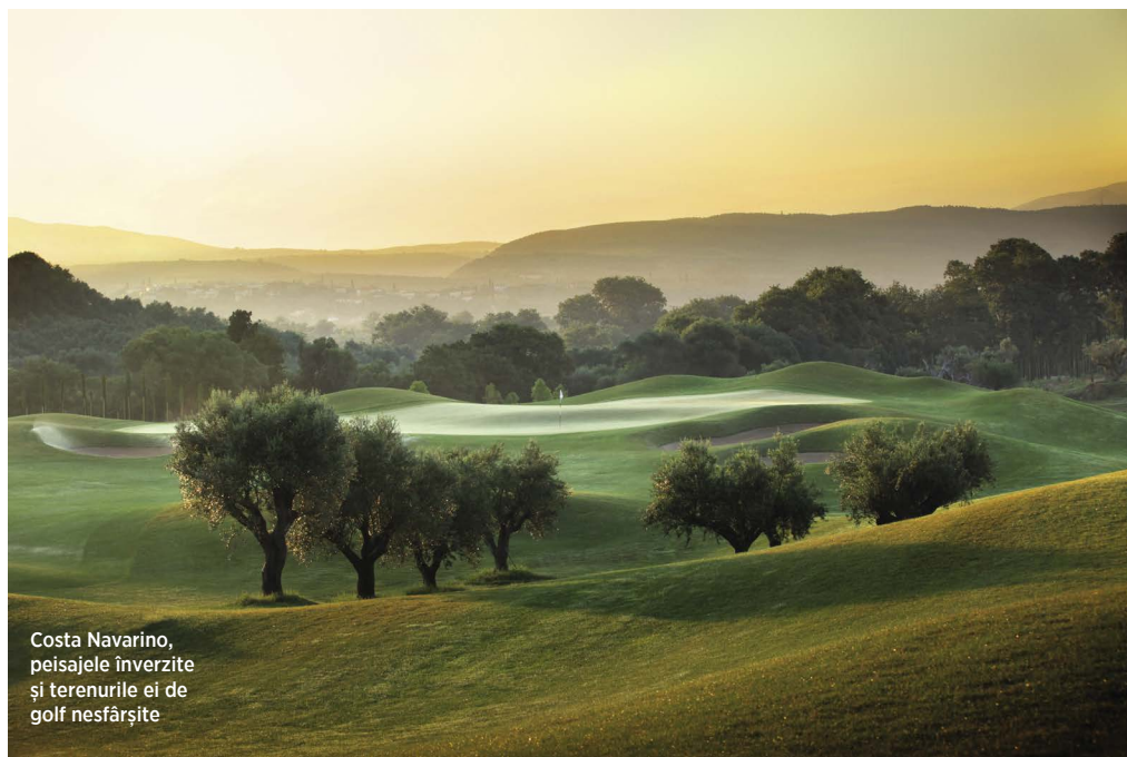
Costa Navarino, peisajele înverzite și terenurile ei de golf nesfârșite