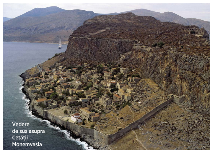
Vedere de sus asupra Cetății Monemvasia