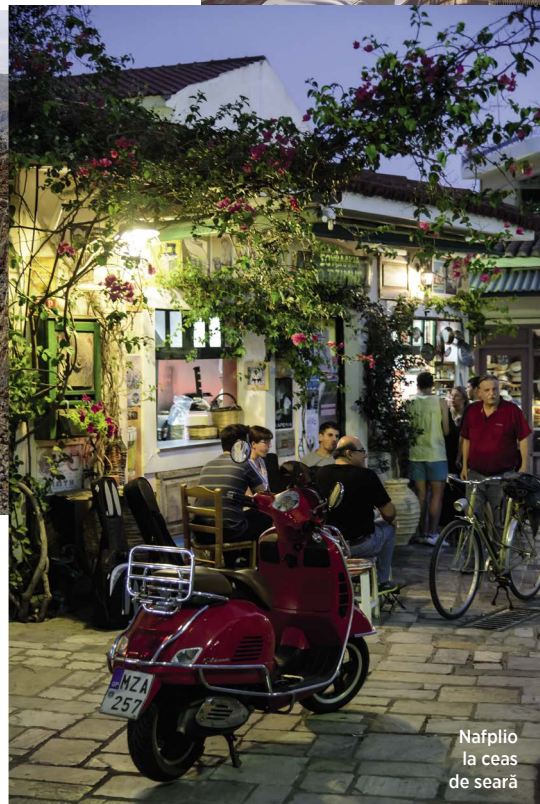
Nafplio la ceas de seară

care se ridică, majestic și idilic în același timp, orașul modern al Monemvasiei, de la plaja Simos și de la linia invizibilă unde Marea Ionică se contopește cu Mediterana și unde am avut parte de cea mai tare baie pe anul 2018... Da, m-am îndrăgostit cu adevărat de această minunată insulă a lui Pelypos (botezată așa după eroul mitologic despre care se spune că ar fi cucerit întreaga regiune) — și cum știu asta? Știu că sunt pierdută iremediabil în Peloponez fiindcă am scris fraza de mai sus dintr-o suflare, fiindcă mi-am amintit denumirile tuturor locurilor prin