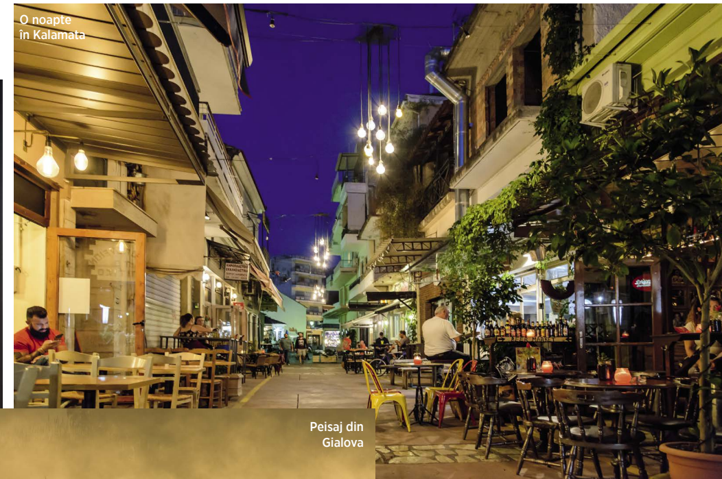
O noapte în Kalamata