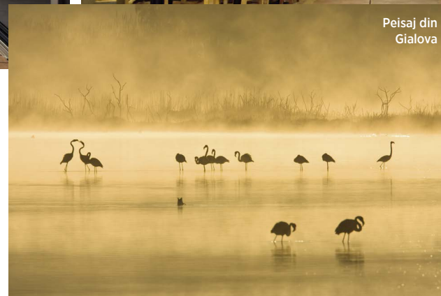
Peisaj din Gialova