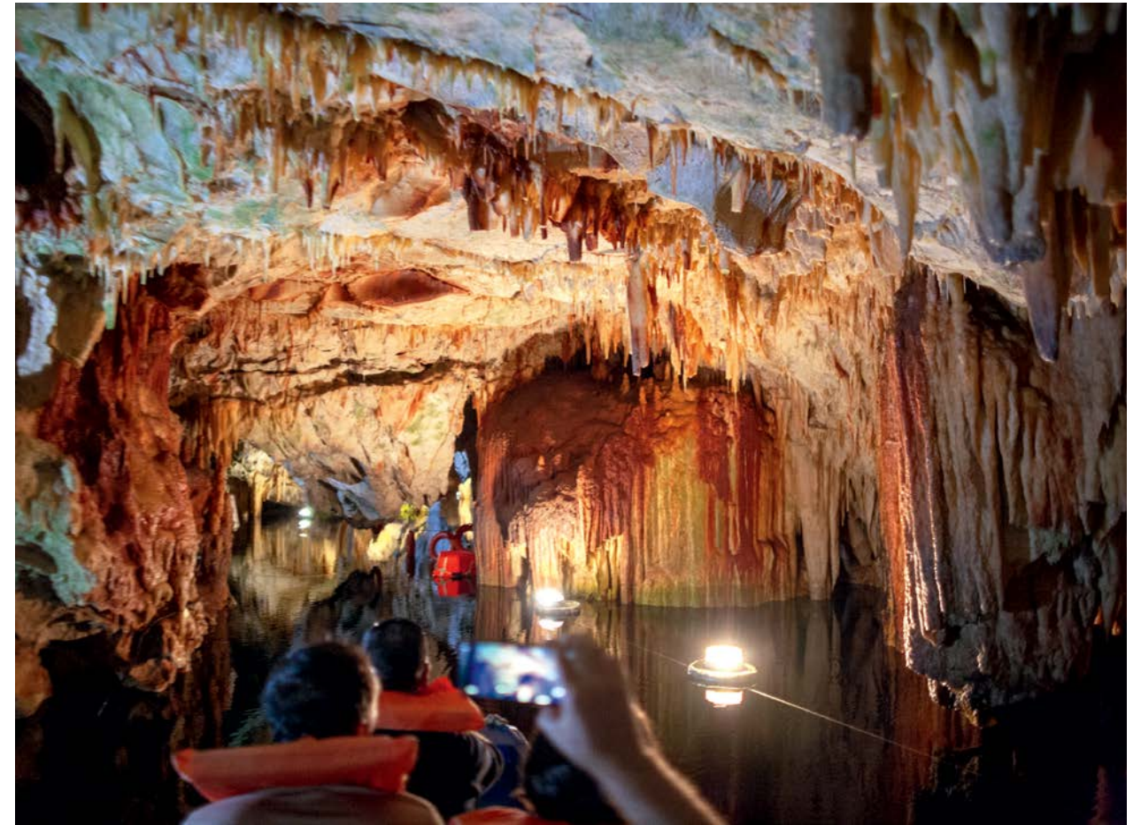
Vizitatorii admiră galeria bogată în speleoteme încercând să capteze cu telefoanele mobile uimitoarele formațiuni precum stalactite, stalagmite, draperii sau cristale de calcit, pe măsură ce înaintează într-o barcă condusă de un ghid pe râul subteran din Diros. Complexul cavernicol din Diros se află la 10 kilometri de Gythio. Un bilet întreg pentru adulți costă 13 euro.

Dantelăria neverosimilă de pe tavanul care pare de ceară, la care un artist divin și capricios modelează cu răbdare, căldură și gravitație de-a lungul eonilor, e excelent pusă un valoare de speologiei care au amenajat-o ca pe o scenă de spectacol de umbre și lumini, printr-o miriadă de spoturi și reflectoare ce o luminează în toată splendoarea ei. Stalactite