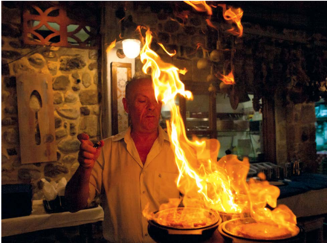
Patronul restaurantului 90 Moires, plasat pe cheiul orașelului Gythio din regiunea Mani, pregătește câteva porții de saganaki , brânză flambată, servită cu suc de lămâie și piper. După acest aperitiv, ca și în alte taverna cu profil pescăresc din Gythio, urmează festinuri cu pești la cuptor, creveți pane sau caracatiță friptă, însoțite de mult ouzo, băutura preferată de localnici în detrimentul vinului alb.

Somnul ritual vindecător, văzut ca metaforă pentru moarte și renaștere, era o etapă în procesul de vindecare, terapia bazându-se pe energie magică, dar și pe autosugestie, hidroterapie, exerciții, dietă, destindere (la jocuri, hipodrom, teatru, concerte etc.), medicamente obținute din ierburi vindecătoare și chiar operații chirurgicale.