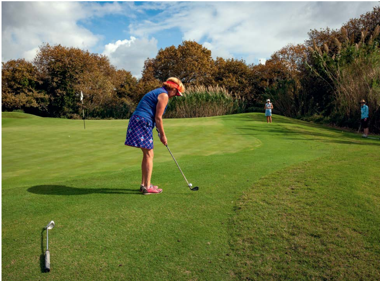
O doamnă din Marea Britanie se antrenează pe unul dintre terenurile de golf ale complexului Costa Navarino din provincia greacă Messinia (sus). Clienții pot găsi clipe de răgaz și pe paturile plasate în spațiul somptuos al resortului The Romanos (dreapta, sus). Din piscina mare de la Costa Navarino (mai sunt peste 100 individuale) poți privi marea bălăcindu-te într-un decor elegant și liniștitor.

A FOST ODATĂ CA NICIODATĂ un băiat sărac din Messinia, care a plecat la Atena să-și caute norocul. A muncit, s-a chinuit, a intrat în Marină, a urcat toate treptele ierarhice până la căpitan, apoi și-a făcut o firmă de transport pe ape care a ajuns una dintre cele mai mari din lume.