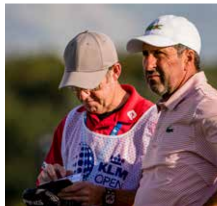
► JOSÉ MARIA OLAZÁBAL IS DE ONTWERPER VAN DE NOEGTE BOUWEN 18-HOLESBANEN VAN NAVARINO HILLS.

Hoewel nog niet officieel bekend, zal er boven op de heuvels ongetwijfeld een extra clubhuis komen, een restaurant en laten we dan ook nog maar inzetten op een extra hotel in de buurt. Tijdens het KLM Open, drie maanden later, vraag ik José Maria Olazábal zelf maar eens naar zijn kijk op de twee nieuwe golfbanen: 'De grootste uitdaging voor het ontwerp was vooral het terrein door al die rotsen. We werden ook beperkt door beschermde begroeiing op bepaalde plekken maar er was ruimte genoeg voor twee flinke banen. Die twee