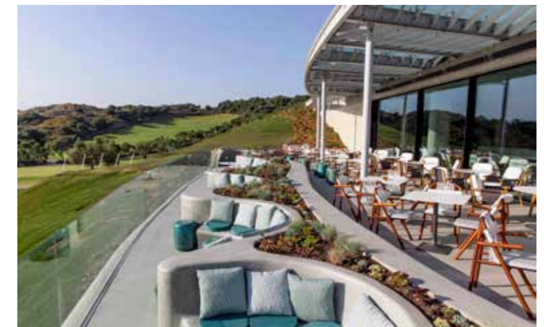
► HET NIEUWE, IN DE AARDE VERZONKEN CLUBHUIS WERD IN JULI 2019 GEOPEND.