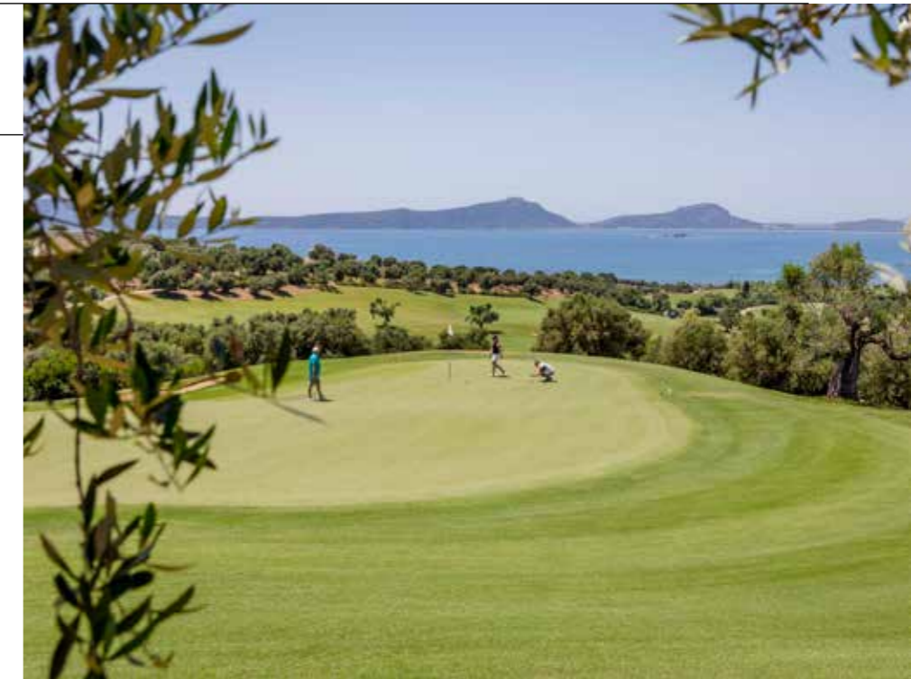
► THE BAY COURSE, NIET AL TE MOEILIK EN EEN PLAATJE VAN EEN BAAN.

De namen van deze twee nog te openen 18-holesbanen op het gedeelte dat Navarino Hills heet, zijn nog niet ☹