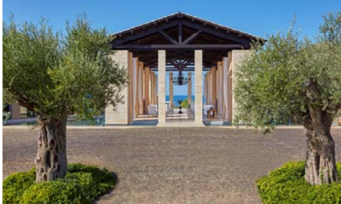
The Romanos, a Luxury Collection Resort

Costa Navarino'nun hikayesi Yunanistan'ın kendisi kadar eski. Eski Pylos'un efsanevi hükümdarı Kral Nestor, 'misafirperverlik' kelimesini tamamen yabancılarla arkadaşlık ederek ilk kez anlamlandırılan büyük bir bilge idi. Der ki, "Burası dostluğun her zaman bulunabileceği, mutluluğun kumdaki ayak sesleriyle ölçüldüğü bir yer."